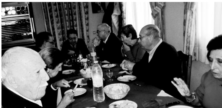
La convivencia de adviento, como todo buen acto de fraternidad, concluyó con una buena comida en un restaurante de Lozoyuela.