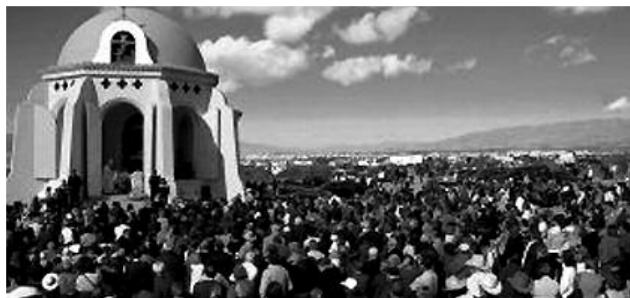
Aspectos de la Romería de enero en Torregarcía.