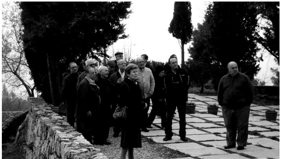
El grupo atiende las explicaciones del guía. Otros se acercan con admiración al sistema de recogida de aguas del convento.