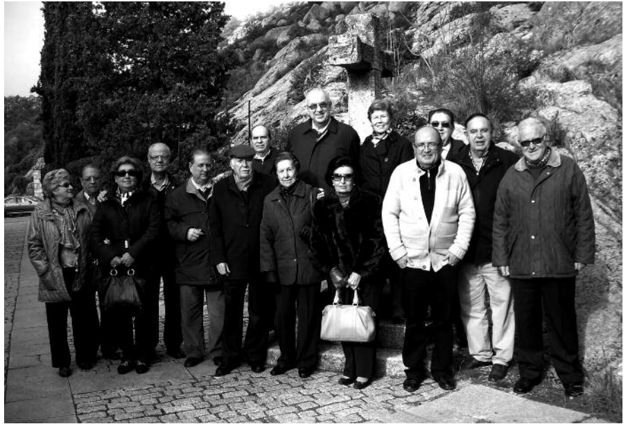
Algunos Hermanos posaron ante el crucero que recibe a los peregrinos en la puerta del monasterio.